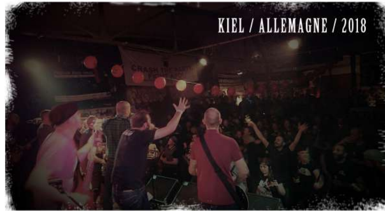
KIEL / ALLEMAGNE / 2018