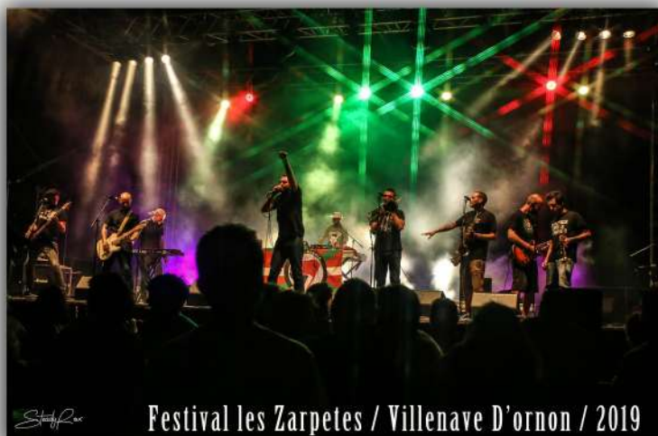
Festival les Zarpetes / Villenave D'ornon / 2019